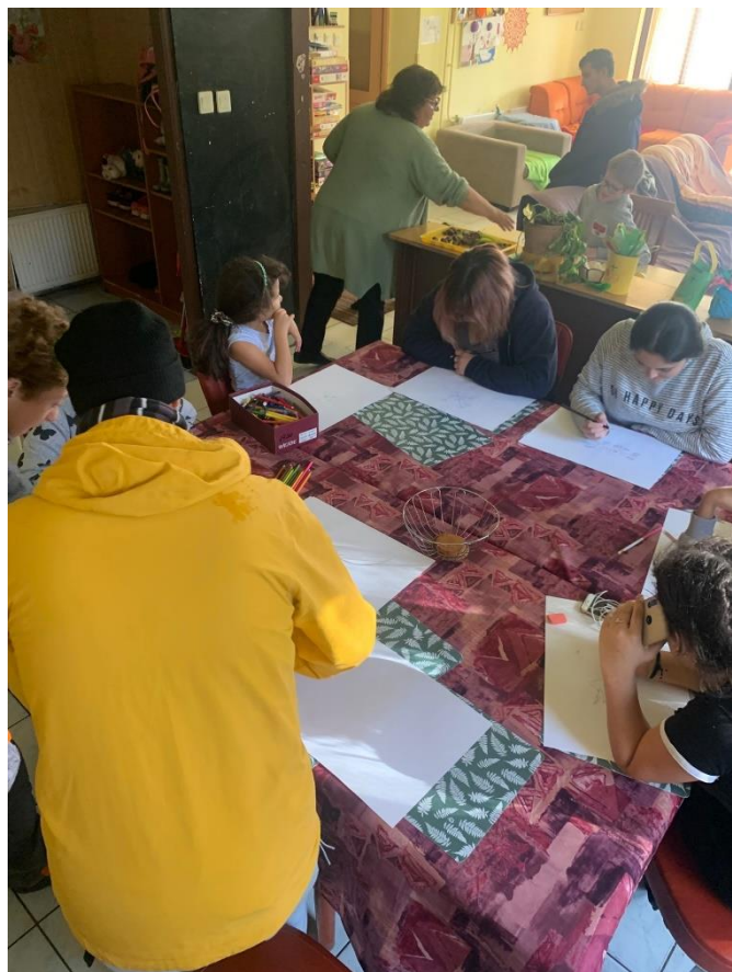
2.kép. A Cseppkő Otthon fiatal szakemberei rajzolják a saját kapcsolataikat.